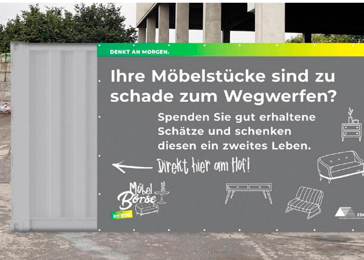
Abbildung 4 Möglichkeit zur Abgabe von Altmöbeln / Dortmund – EDG Möbelbörse

Bei Containern, in denen Gegenstände zum Weiterverkauf eingestellt werden sollen, müssen jedenfalls von Anfang an gute und für die Vermarktung geeignete Qualitäten an Gegenständen gesammelt werden. Nur so kann die Vorbereitung zur Wiederverwendung wirklich realisiert werden und unnötig zusätzlicher logistischer Aufwand etwa durch eine Verbringung in ein Gebrauchtwarenkaufhaus und – wegen Nicht-Absatzes – wieder zurück