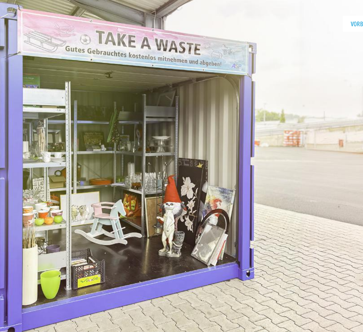
Abbildung 1 Tauschecke Paderborn

von periodischen oder gelegentlichen Vor-Ort-Märkten stattfinden oder auch permanente online-Märkte sein. Es gibt in verschiedenen Fällen auch eigene Verschenke-Apps einzelner öffentlich-rechtlicher Entsorgungsträger. Sehr häufig werden auch von den öRE auf den Wertstoffhöfen Tauschecken eingerichtet, wo die Kunden der Wertstoffhöfe Gegenstände einstellen können (etwa Accessoires, Bücher, Spielzeug, kleine Möbelstücke), die dann von anderen Kunden bei Interesse mitgenommen werden können.